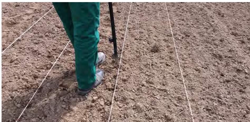
Fotografía 1. Detalle de la siembra manual con bastón en una parcela elemental con las líneas de siembra delimitadas.

La evaluación en cada campo experimental comienza con la preparación del terreno, fertilización, delimitación de parcelas elementales, siembra de las variedades en las mismas y tratamientos fitosanitarios. La siembra se realiza siempre de forma manual (ver fotografía 1) y de forma que las variedades de un mismo ciclo queden agrupadas.