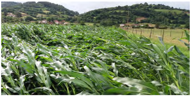
Fotografía 3. Efecto de las fuertes rachas de viento del 28/06/2017 en el campo de evaluación de variedades de la zona interior baja (Grado).

Aunque el viento en general, a lo largo del periodo de crecimiento del cultivo sopló de acuerdo a lo esperado, cabe destacar que durante el mes de junio hubo episodios puntuales con rachas fuertes, llegando a alcanzar los 114 km/h el 28 de junio en la zona costera occidental (observatorio del Cabo Busto, concejo de Valdés). En la fotografía 3, y a modo de ejemplo, se puede observar el efecto que sobre el cultivo de maíz ejercieron dichas rachas de viento, cuando las plantas de maíz ya tenían una altura suficiente como para ser tumbadas sin capacidad de recuperación (ver fotografía 3).