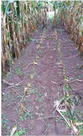
Fotografía 2. Efectividad del herbicida sobre el control de malas hierbas.

Inmediatamente después de la siembra se añadieron los herbicidas e insecticidas convencionales para el cultivo del maíz. La efectividad de los herbicidas se muestra en la fotografía 2.